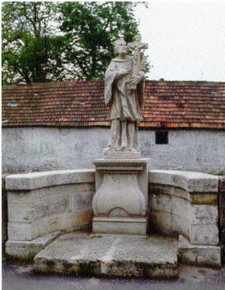
Nepomuki Szent János szobra a 15. sz. főút 0 + 250 km szelvényében lévő Lajta-hídon, Mosonmagyaróváron. Anyaga kő, készült 1754-ben, műemlék. (Hidak Győr megyében. Győr, 1993. Mentes Zoltán főmérnök úr fényképfelvétele.)